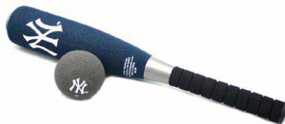
BATE JUMBO C BOLA