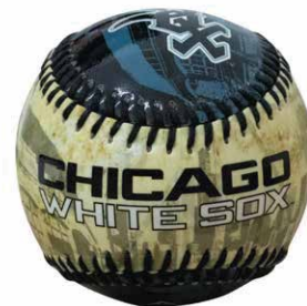
PELOTAS DE BEISBOL