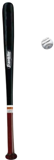
BATE DE MADERA 25" CON PELOTA